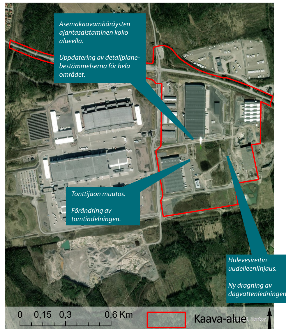
Kaavan alustavat tavoitteet. Planens preliminära mål.

eller någon betydande förändring av byggrätten.