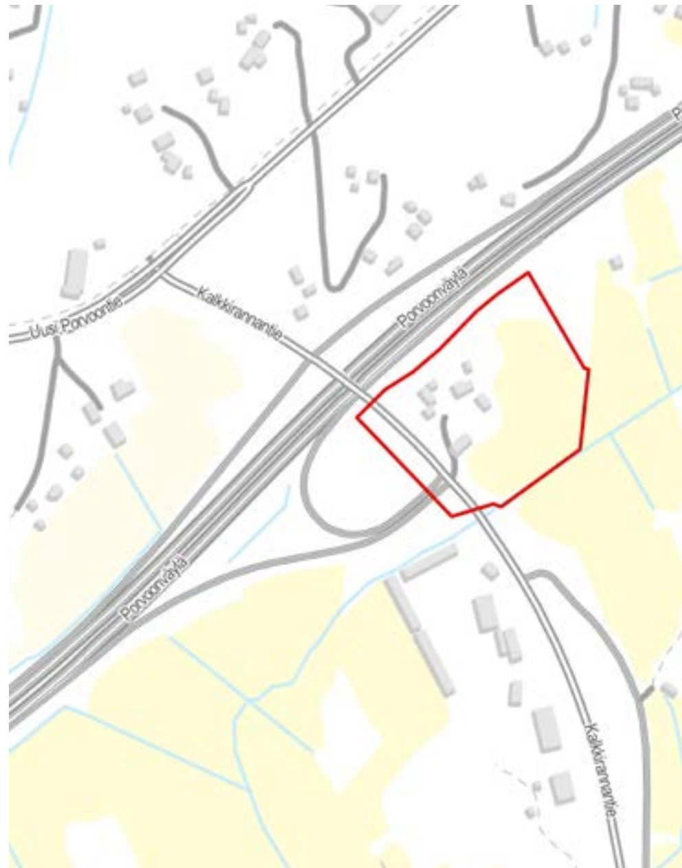
Suunnittelualue. Planeringsområdet.

Konsekvensbedömningens uppgift är att stöda planberedningen och val av godtagbara planlösningar samt fungera som hjälp vid bedömningen av hur planens mål och innehållskrav förverkligas. Planens konsekvensbedömning grundar sig på basutredningar över området, på