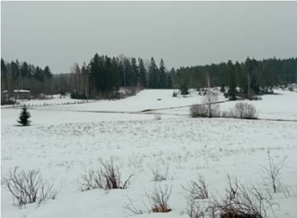
Näkymä pihapiiristä itäpuoliselle peltoaukealle. Vy från gårdstunet mot det öppna åkerlandskapet i öster.

Porvoon moottoritien ja Kalkkirannantien risteystä. Alueen kokonaispinta-ala on noin 3 ha. Asemakaavan suunnittelualue käsittää kiinteistön 753-408-0005-0040 ja yleisen tien aluetta.