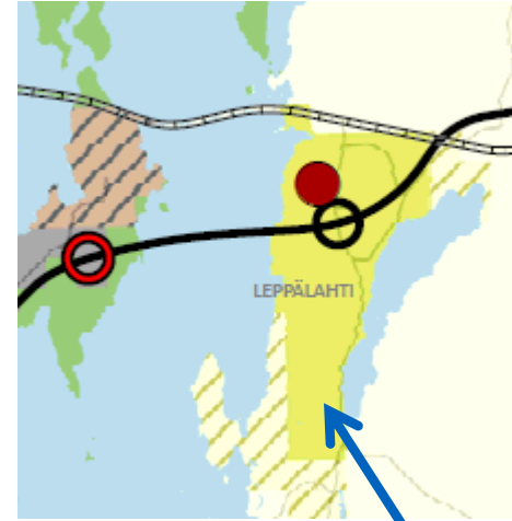
Yleispiirteinen yleiskaava ja alueellinen suunnittelutarveratkaisu