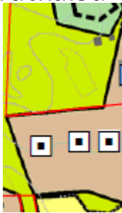
Esimerkkejä Jyväskylän yleiskaavoista