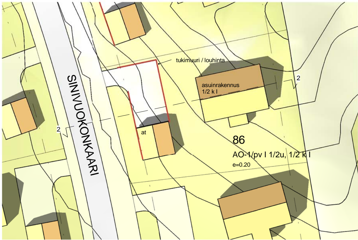
1. Kortteli 86 tontti 2 1 : 500