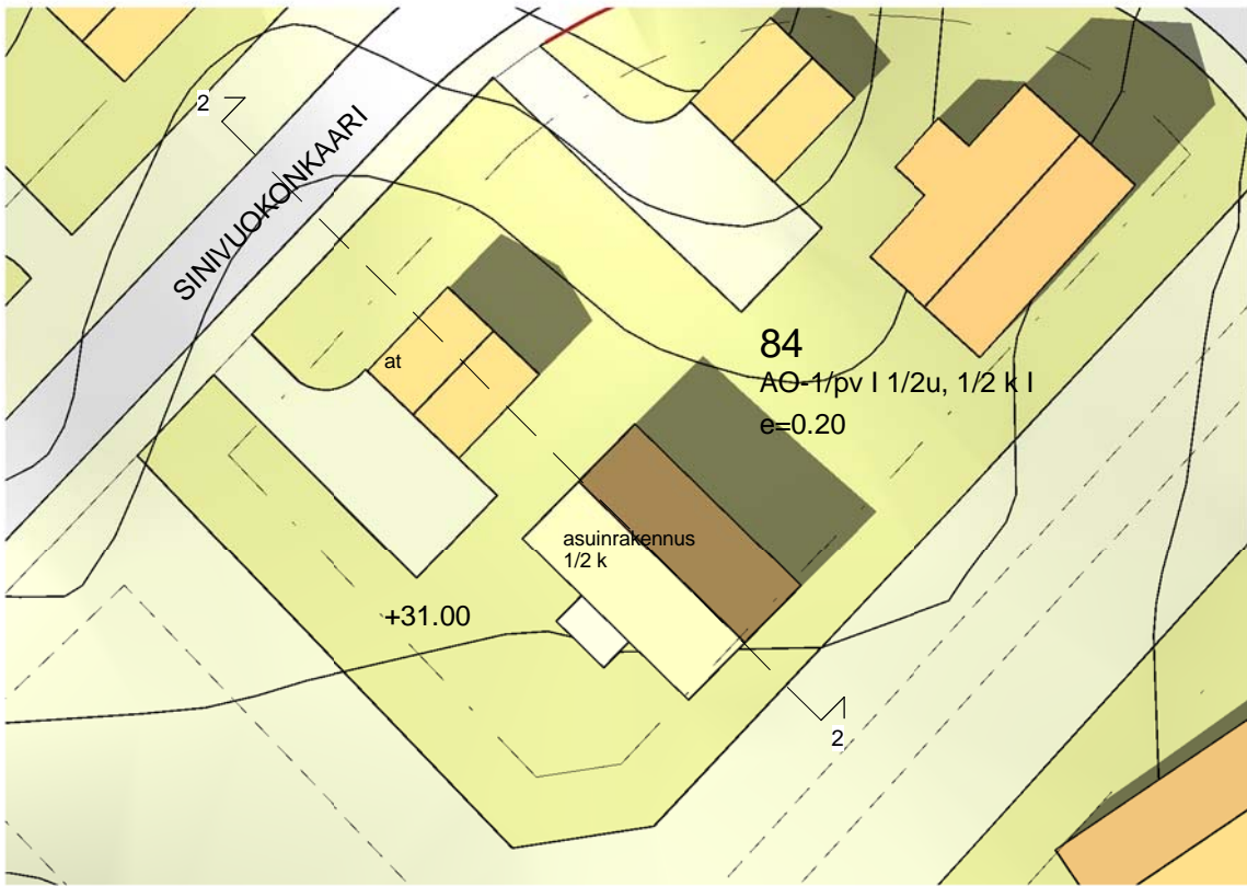
1. Kortteli 84 tontti 2 1 : 500