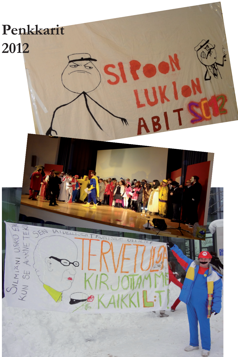
Sipoon lukion vuosikertomus 2011-12