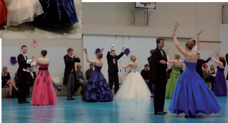
Sipoon lukion vuosikertomus 2011-12