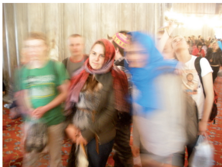
Sipoon lukion vuosikertomus 2011-12

Torstaina teimme retken Istanbulin keskustaan ja kiersimme tärkeimpiä nähtävyyksiä. Kävimme upeassa Hagia Sofiassa, yhdessä bysantilaisen arkkitehtuurin merkkiteoksista ja Sinisessä moskeijassa, joka kuuluu Istanbulin tärkeimpiin nähtävyyksiin. Pääsimme myös basaariin ostoksille, tosin tiukka aikataulu piti huolen, ettei tullut liikaa osteltua tuliaisia. Basaarissa oli mahdollisuus tehdä edullisia löytöjä: nahkakakkeja ja muita vaatteita, koruja sekä matkamuistoesineitä. Istanbulin keskustassa sai olla hereillä laukkujen ja itsensä