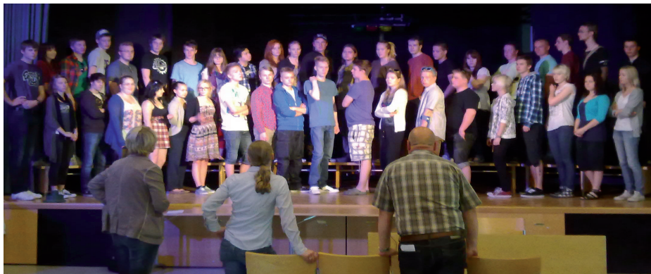
Sipoon lukion vuosikertomus 2011-12