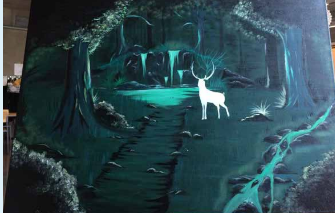
– The Emerald Dream – akryylimaalauk, 65x90 cm Julia Janhunen 2A /tehtävä nro 2b: Pihoilla ja puutarhoissa