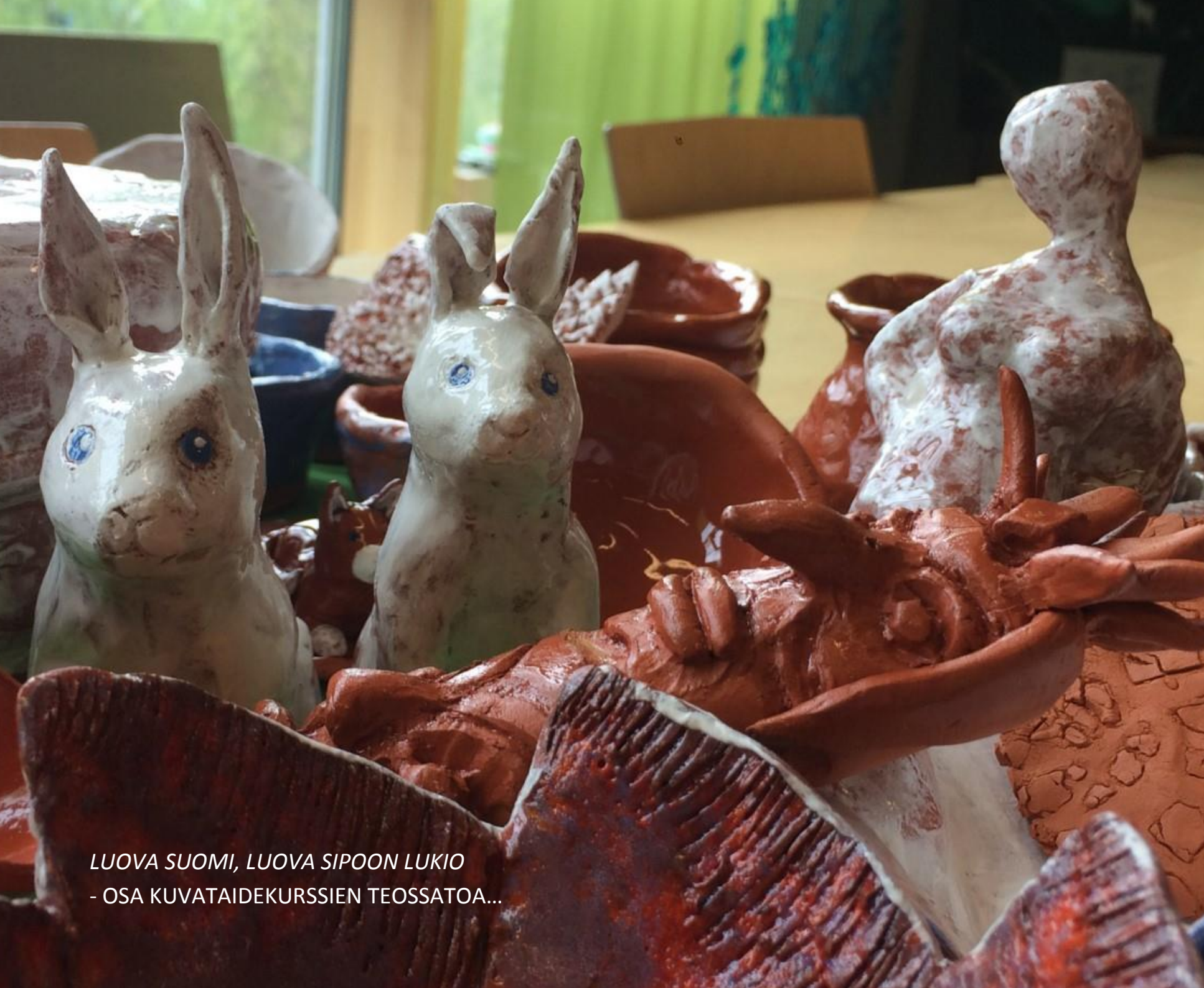
LUOVA SUOMI, LUOVA SIPOON LUKIO - OSA KUVATAIDEKURSSIEN TEOSSATOA...