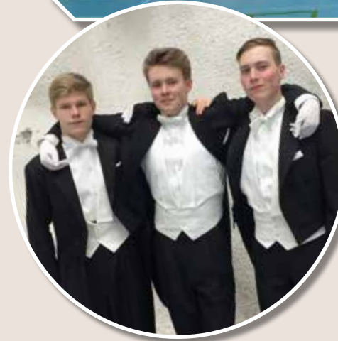
Wanhon päivä 17.2.2017