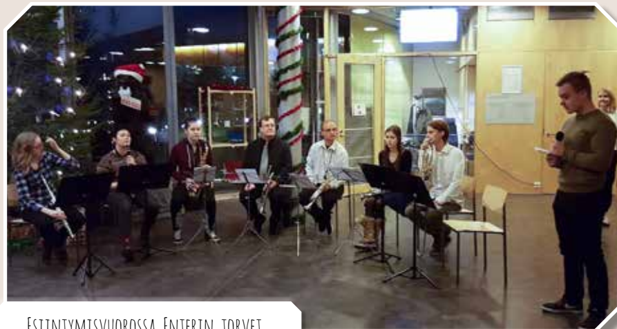
ESIINTYMISVUOROSSA ENTERIN TORVET.

Lukion ja Keudan yhteisessä joulujuhlissa askarreltiin, laulettiin joululaulukaraokea ja virittäydettiin muutoinkin joulutunnelmaan.