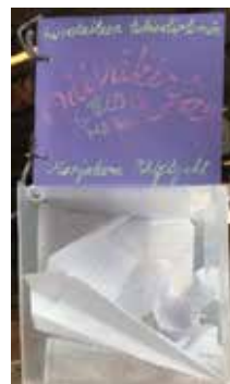
– Prosessi – installaatio, 15x15x15cmx3kpl, muovikuutiot sisältöineen

ja portfolioista. Lukiodiplomit ovat lukion yleisivistävän koulutustehtävän mukaista toimintaa. Lukiodiplomi tarjoaa lukion opiskelijalle mahdollisuuden antaa erityisen näytön osaamisestaan ja harrastuneisuudestaan. http://edu.fi/lukiokoulutus/lukiodiplomit