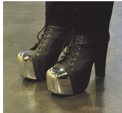
Tyyliä kouluun lauantainakin