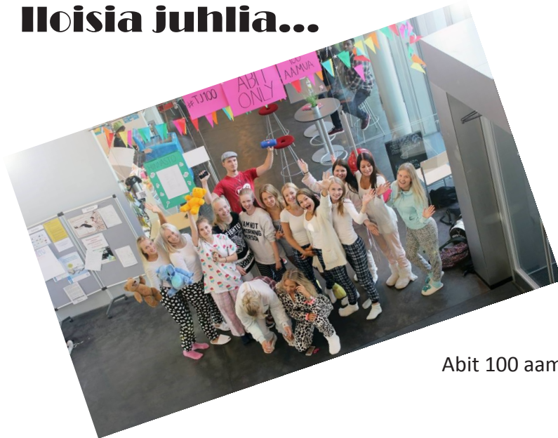
Abit 100 aamua

Abit villiintyivät vain 100 jäljellä olevan aamun edessä pukeutumaan perinteiden mukaisesti yöpu-kuihin.