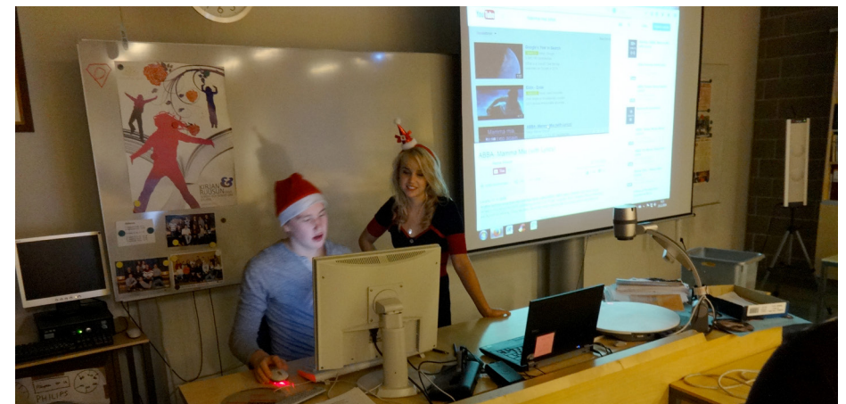
Oppilaskunnan joulukaraokessa oli tunnelmaa.