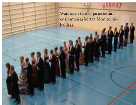
Wanhojen tanssit järjestettiin ensimmäistä kertaa Monitoimihallissa.