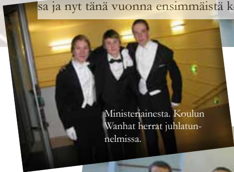
Ministeriainesta. Koulun Wanhait herrat juhlatunnelmissa.

Tansseja on pidetty C-rakennuksen liikuntasalissa, Lukkarin koulun salissa, AIV-salissa ja nyt tänä vuonna ensimmäistä kertaa monitoimihallissa.