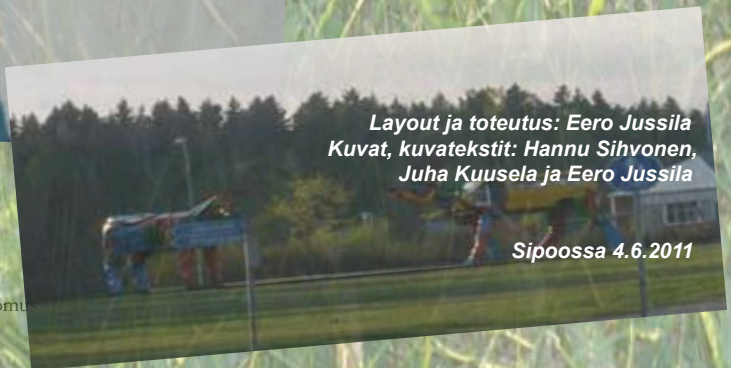
Layout ja toteutus: Eero Jussila