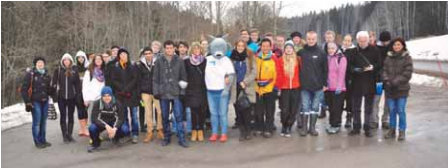
Yhteiskuva koko ryhmästä ja Sipoon sudesta ennen Sipoonkorpeen lähtöä.

Sipoon lukio osallistui Das grüne Europa Comenius -projektiin 2011 - 2013. Projektin kieli oli saksa ja teemana eurooppalaiset luonnonmaisemat. Projekti oli kaksivuotinen ja keväällä 2012 kymmenen saksanopiskelijaa Sipoon lukiosta lähti viikoksi Istanbuliin ystävyyslukiomme Kartal Andolu lisesin vieraiksi. Siellä majoituimme paikallisten opiskelijoiden perheissä. Tutustuimme Istanbulissa Marmarismereen ja Prinssisaariin tehden siellä retkiä. Viime syksynä vuorossa oli vierailu Saksan Mönchengladbachiin, jossa olimme Franz-Meyers lukion vieraina. Saksalaiset järjestivät meille retkiä Saksan ja Belgian välissä sijaitsevalle suojellulle Hohes Venn-suovalueelle ja vulkaaniseen luonnonpuistoon Vulkaneifeliin. 13.4. - 20.4.2013 molemmista maista saapui kymmenen opiskelijaa opettajiineen tutustumaan suomalaisiin luonnonmaisemiin ja kulttuuriin tänne Sipooseen. Nyt oli meidän vuoromme majoittaa ulkomaalaiset vieraat. Erityiskohteinaamme Suomessa olivat Itämeri ja Sipoonkorven luonnonpuisto.