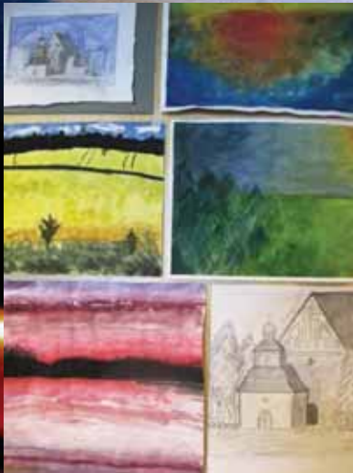
Kannen taidekuvat Sipoon lukion oppilastöitä kuvataidekurssilta 2012–2013

Sipoon lukio Iso Kylätie 14 04130 Sipoo www.sipoo.fi/lukio lukio@sipoo.fi