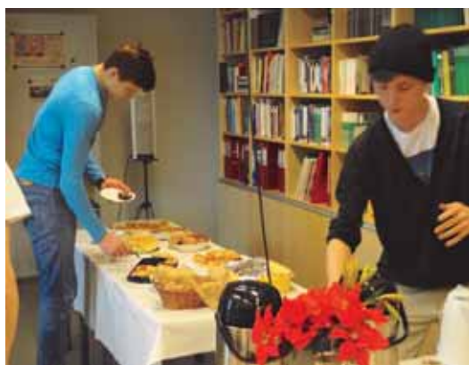
Abien järjestämällä läksiäiskahveilla pöytä oli koreana ja tunnelma rattoisa.