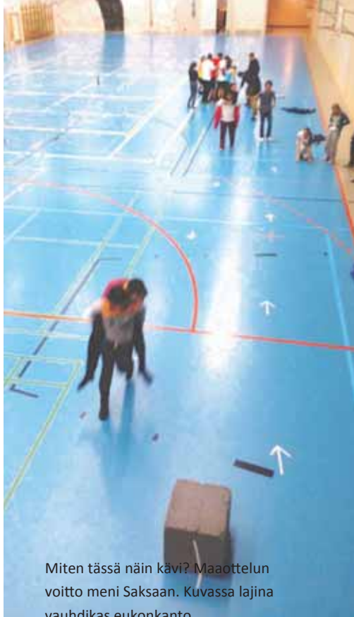
Miten tässä näin kävi? Maaottelun voitto meni Saksaan. Kuvassa lajina vauhdikas eukonkanto.

Projektin aikana me suomalaiset opimme paljon eri maiden luonnonmaisemista, luonnonsuojelusta ja ennen kaikkea kulttuurieroista. Pääsimme myös hioamaan saksankielen taitojamme ja viettämään aikaa ulkomaalaisten kanssa, mikä oli opettavaista. Solmimme uusia ystävyys-suhteita – jotkut syvempiä kuin toiset. Suosittelemme vastaavia projekteja kaikille, sillä antoisaa projektissa oli yhdessä tekeminen, kansainvälinen ilmapiiri ja kulttuurielämykset.