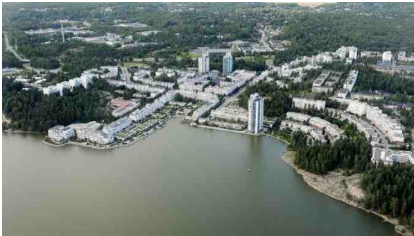
Kivenlahden rantaa.

”Asuntosäätiön lohkolla” Kivenlahdessa on harastettu tapiolamaisesti monenlaista maastoon sopeuttamista, kuten Merikeskuksen/Meritorin amfiteatterimainen rivitalo-terassitalo merenrantakalliolla ja tähän sopeutettu, rantaviivasta kasvava, aikoinaan Suomen korkein asuintalo Meritorni. Amfin, Meritornin ja kallion kerrostalojen korkeudet ovat sovitettu toisiinsa. Ylä- ja Ala-Kivenlahden 25 metrin tasoero ratkaistiin maastoa säästävällä poikkeuksellisesta liikennetunnelilla.