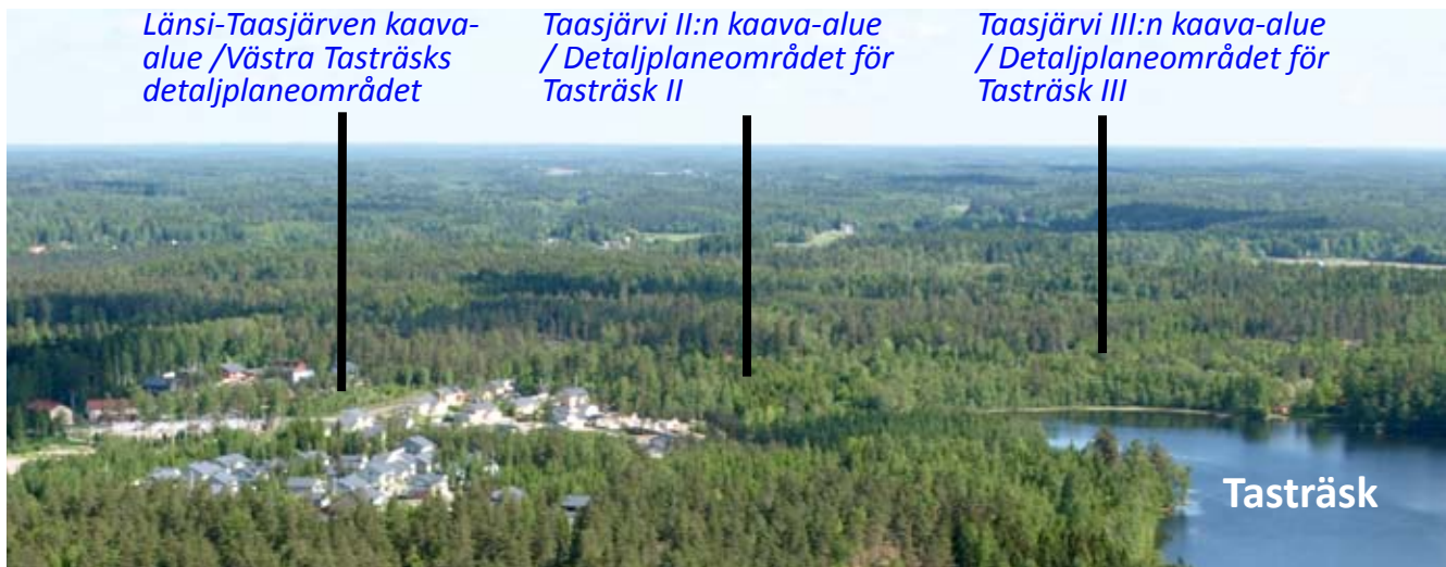
Ilmakuva Taasjärvi III:n sijainnista / Flygfoto av Tasträsk III läge

Planområdet gränsar till det kommunala vatten- och avloppsnätet. Även fjärrvärme kommer till planområdet Tasträsk II i väster och avsikten är att utvidga nätet längs Tasbyvägen till planeringsområdet.