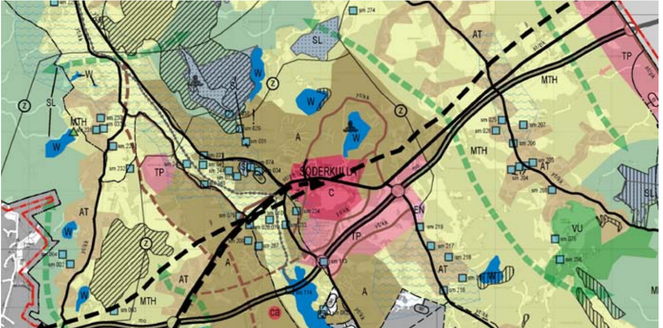
Ote Sipoon yleiskaavasta 2025 (kv 15.12.2008). Utdrag ur generalplan för Sibbo 2025 (fullmäktige 15.12.2008).

I den av Sibbo kommunfullmäktige 15.12.2008 godkända lagkraftiga generalplanen för Sibbo 2025 med rättsverkningar är planområdet ett område för tätortsfunktioner (A). Genom området går en förbindelseväg/matargata med beteckningen yt/kk. Vägen går kring träsket. Från området i riktning mot nordost finns en beteckning för en elledning.