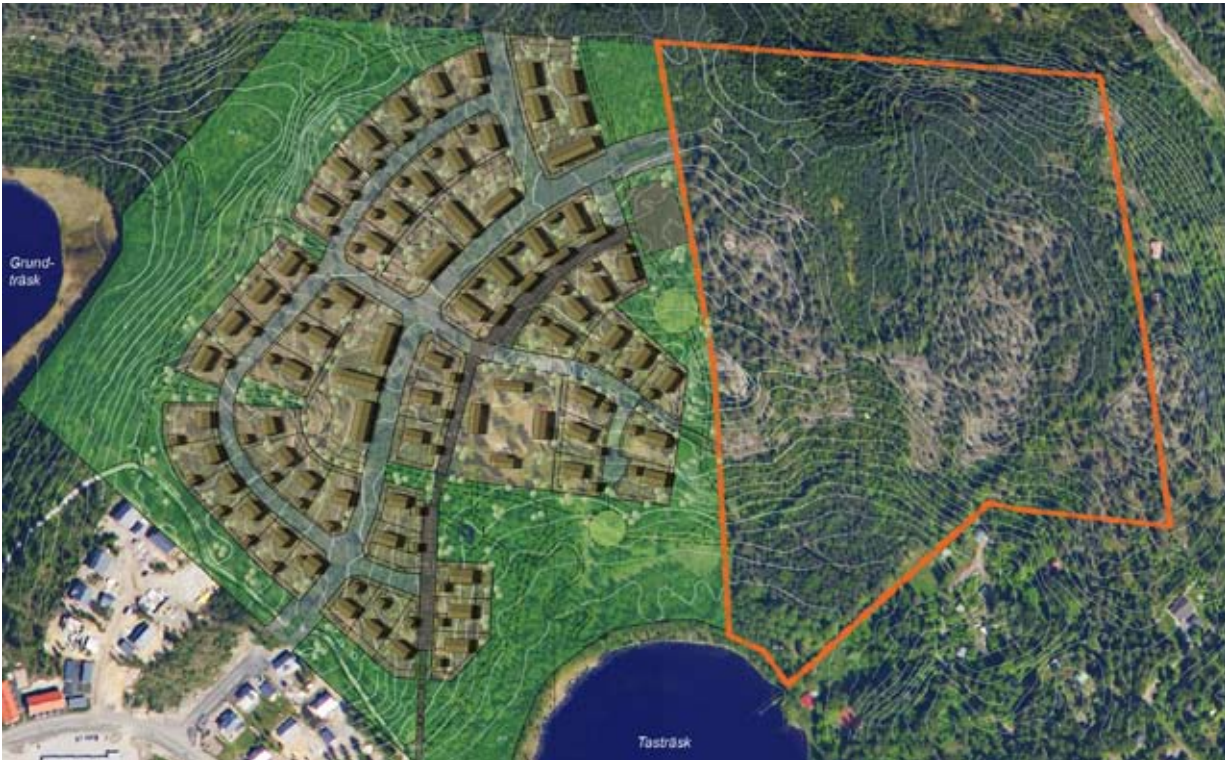
Ilmakuva v. 2009 ja Taasjärvi II:n havainnekuva. Kaava-alueen alustava raja- ja rajaus esitetty kuvassa punaisella. Flygbild av planområdet från år 2009 och illustration över Tasträsk II. Planområdets preliminära avgränsning anges på bilden med rött.